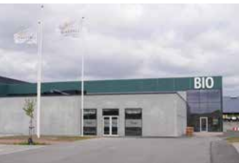
Senest er Lanternen udvidet med en biograf.