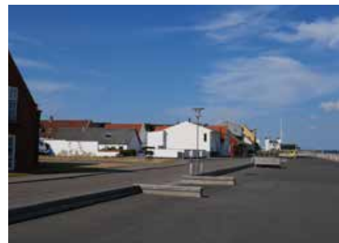
Den unikke beliggenhed i området fra hjørnet af Limfjordsvej og Havnevej kan udnyttes bedre.