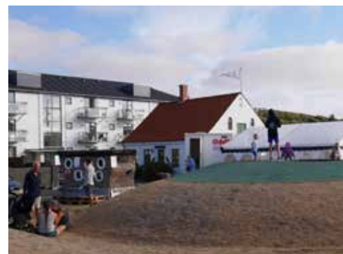
Der kan indrettes aktivitetsmuligheder langs den blå og grønne sti som her ved havnefronten.

Stien anlægges med aktivitetsmuligheder undervejs. I den sydlige del ved Danmarksvej og Tinghøj skal der findes en god linjeføring for de manglende 1,2 km sti. Langs den nye sti kan der suppleres med en grøn kile med skov eller natur for at skabe et smukkere og mere interessant stiforløb på strækningen. Der kunne f.eks. indrettes en hundeskov, som flere har efterspurgt. Der arbejdes med en ide om en fitness-plads i forbindelse med en sti til Ravnstrup.