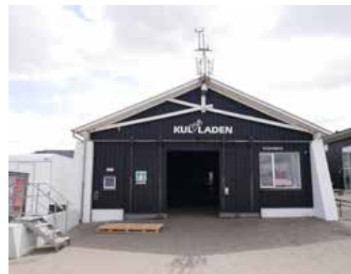
Kulturladen kan indrettes til store arrangementer og udvides bagud eller til siderne. Hvordan det præcist kan ske må undersøges nærmere.