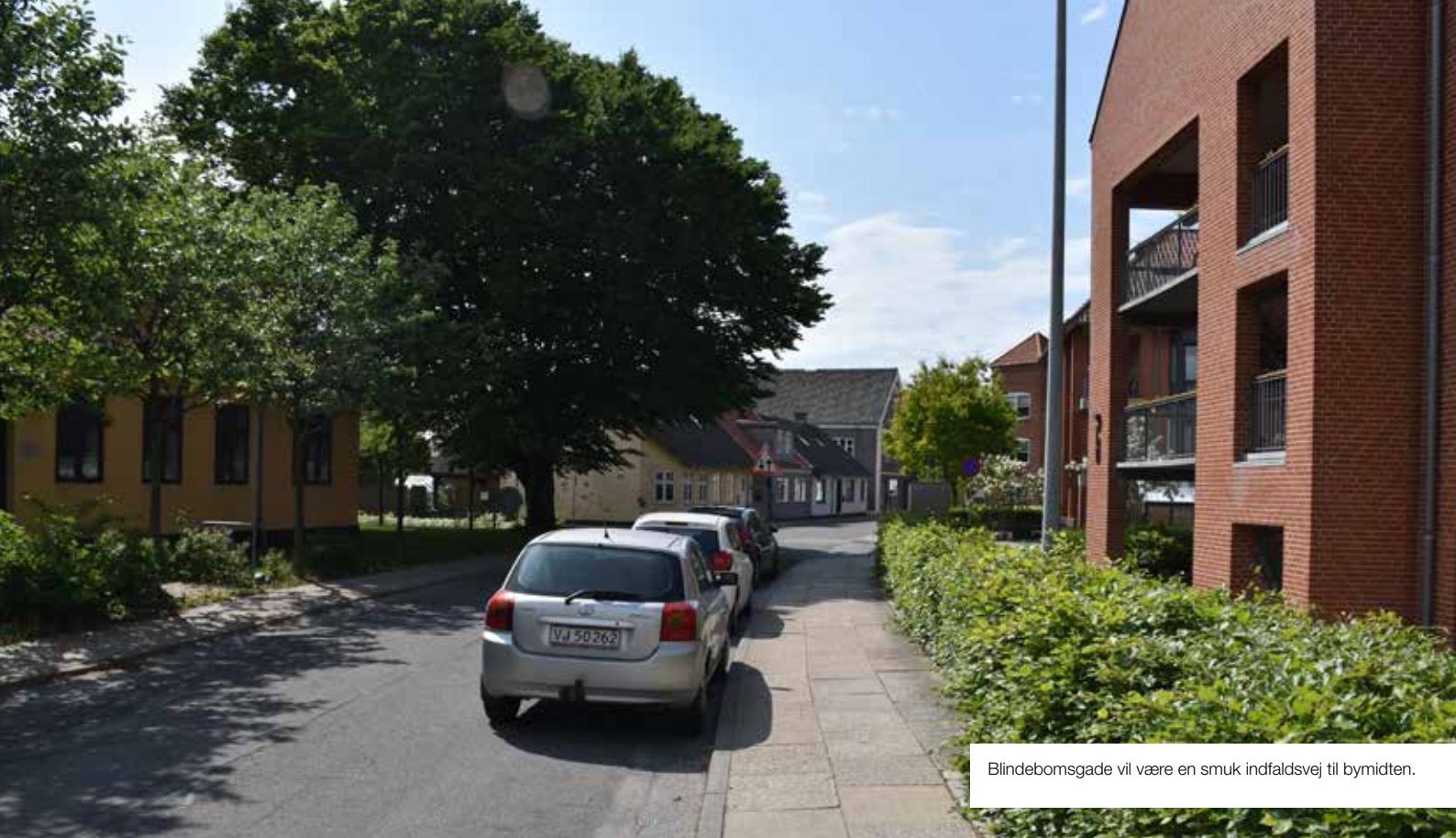
Blindebomsgade vil være en smuk indfaldsvej til bymidten.