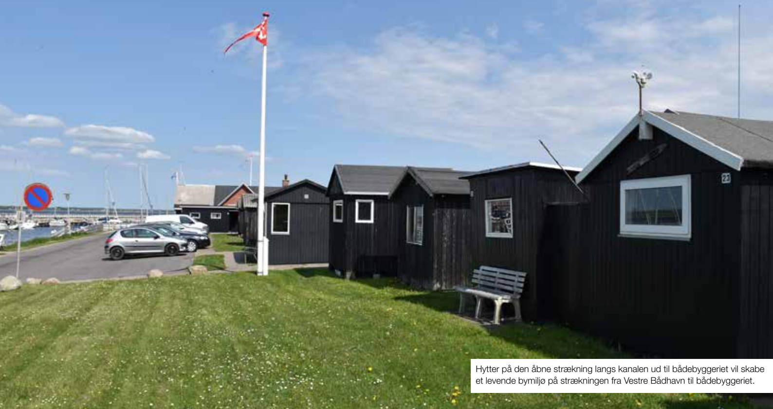
Hytter på den åbne strækning langs kanalen ud til bådebyggeriet vil skabe et levende bymiljø på strækningen fra Vestre Bådhavn til bådebyggeriet.