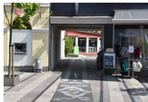
Gode og synlige passager til parkeringspladserne er vigtige for handelslivet.