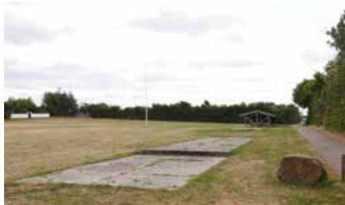
Dyrskuepladsen fastholdes som grønt område.