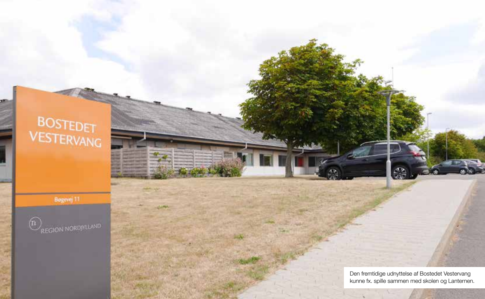
Den fremtidige udnyttelse af Bostedet Vestervang kunne fx. spille sammen med skolen og Lanternen.

skaber en god overgang fra børnehave til skole. Både skole og børnehave kan udnytte Lanternens gode faciliteter.