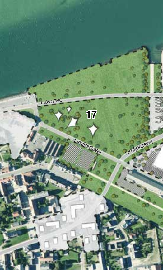
ETAPE 1- Klargøring til byudvikling.