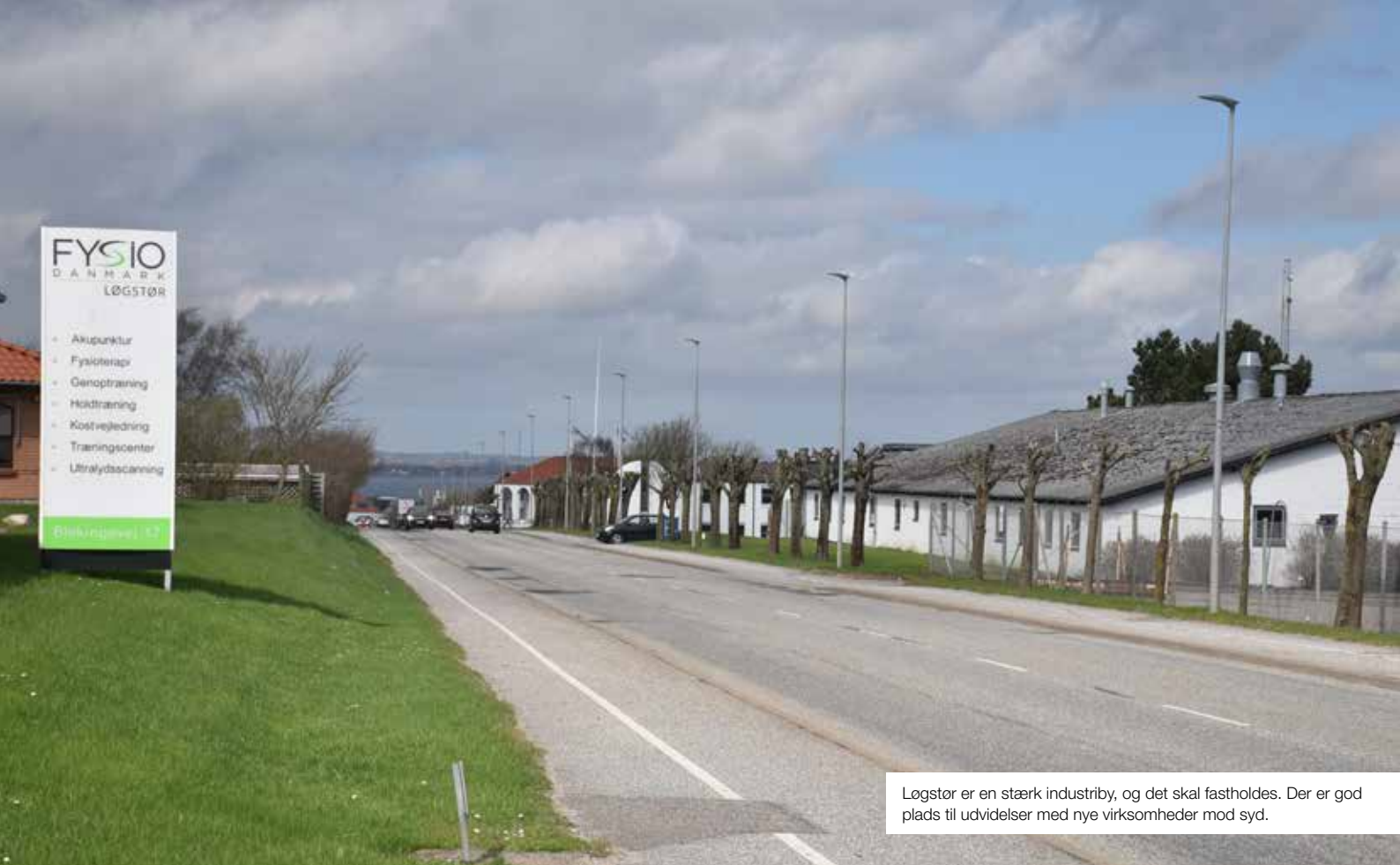
Løgstør er en stærk industriby, og det skal fastholdes. Der er god plads til udvidelser med nye virksomheder mod syd.

fartdæmpere i Bredgade. Næste skridt kunne være at lede hovedparten af den gennemkørende trafik via Havnevej. Det vil betyde, at Bredgade kan blive et fredeligt boligområde uden gennemkørende trafik. Hvordan, trafikken præcist skal omlægges, ligger ikke fast. Kortskitsen viser en mulighed, hvor der bliver indkørselsforbud til Bredgade fra rundkørslen ved Aalborgvej (projektforslag 2). I stedet foreslås en ny vej (projektforslag 3) fra Havnevej til Bredgade lige efter J. Haldrup A/S. Det vil fortsat gøre det let for beboerne i Bredgade at komme til og fra byen, men det vil ikke være attraktivt for andre at benytte Bredgade.