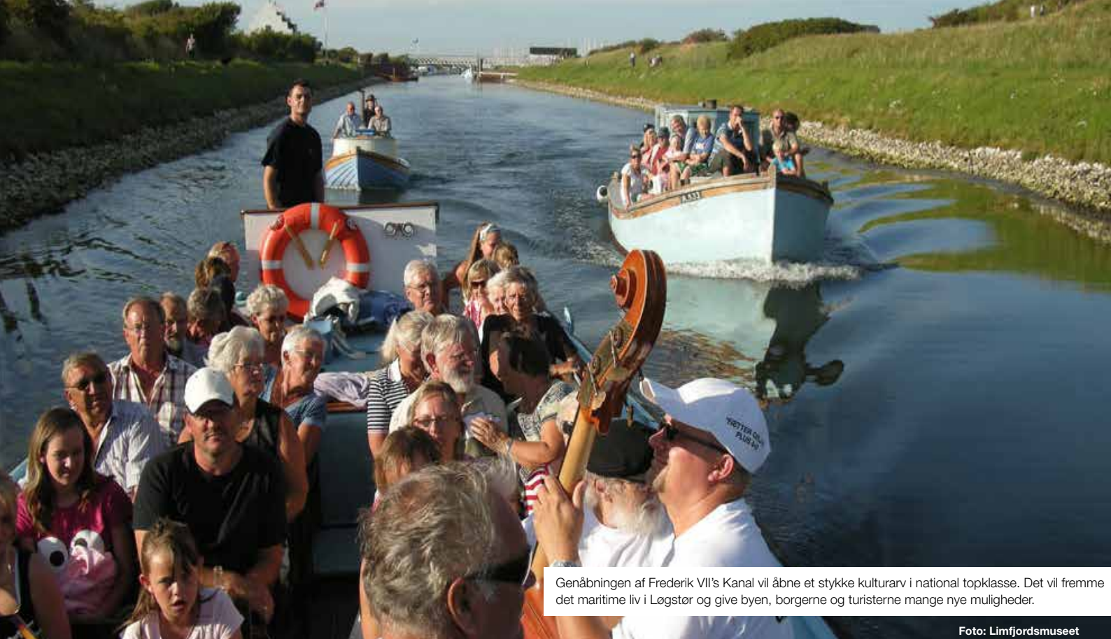
Genåbningen af Frederik VII's Kanal vil åbne et stykke kulturarv i national topklasse. Det vil fremme det maritime liv i Løgstør og give byen, borgerne og turisterne mange nye muligheder.