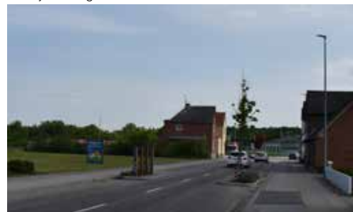
Arealet ved hjørnet ud til rundkørslen ved Aalborgvej kunne laves til et stort grønt område.