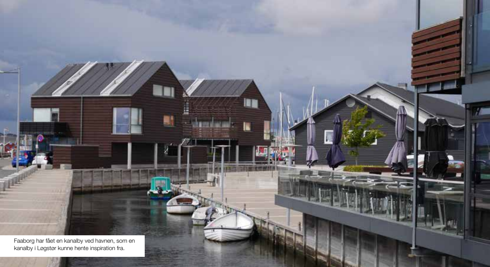
Faaborg har fået en kanalby ved havnen, som en kanalby i Løgstør kunne hente inspiration fra.