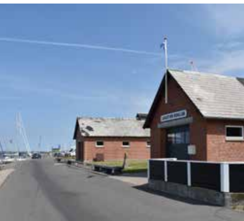
Roklubbens nuværende bygninger er utidssvarende, men de har en god beliggenhed ud til kanalen.