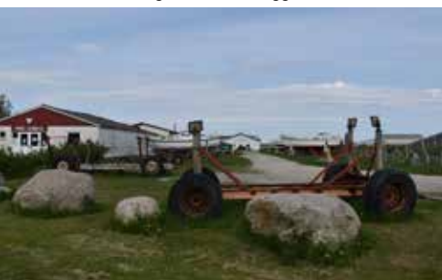
I første omgang skal der rives ned, ryddes op og gøres pænt.