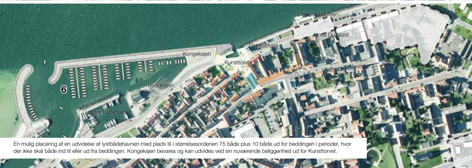
En mulig placering af en udvidelse af lystbådehavnen med plads til i størrelsesordenen 75 både plus 10 både ud for beddingen i perioder, hvor der ikke skal både ind til eller ud fra beddingen. Kongekajen bevares og kan udvides ved sin nuværende beliggenhed ud for Kunsttorvet.