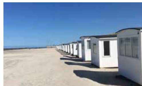
Hytter og småbygninger ved vandet skaber smukke og oplevelsesrige miljøer mange andre steder.