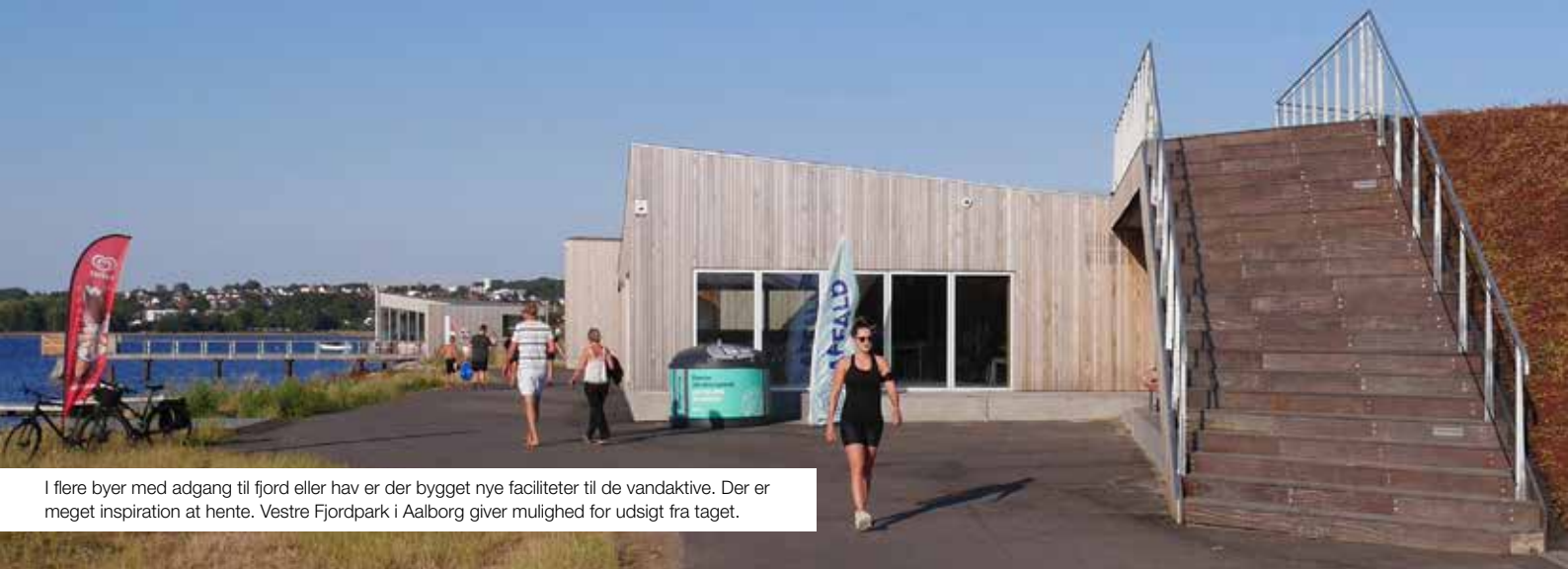
I flere byer med adgang til fjord eller hav er der bygget nye faciliteter til de vandaktive. Der er meget inspiration at hente. Vestre Fjordpark i Aalborg giver mulighed for udsigt fra taget.