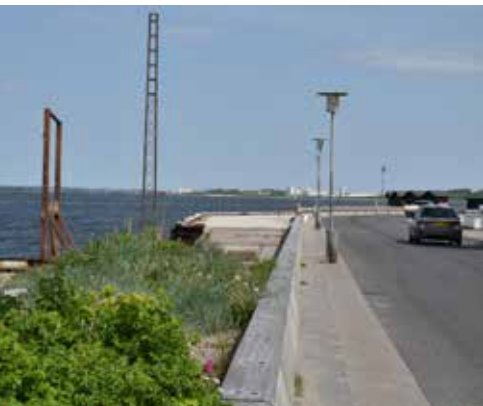
En udvidelse af fortovet langs beddingen vil sammen med et boardwalk skabe mulighed for at færdes adskilt fra biler langs hele havnefronten og kanalen.