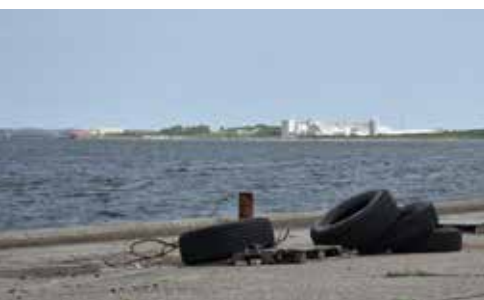
Der er flot udsigt til fjord og landskaber.