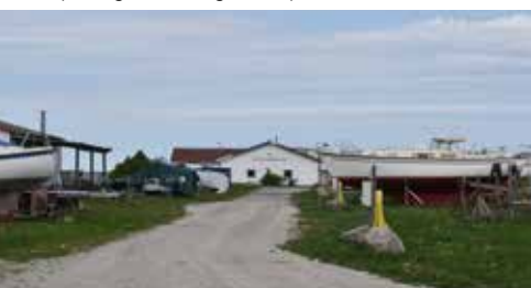
Den nuværende plads til vinteropbevaring af både flyttes tættere på industrihavnen.