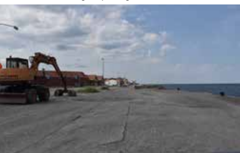
Området er for godt til bare at ligge hen.