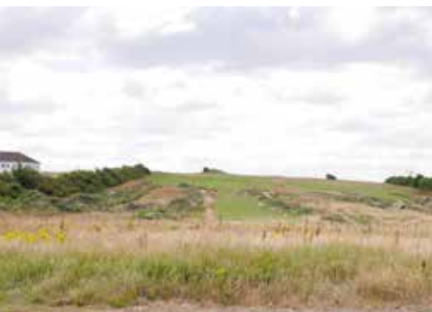
Vest for Løgstør Parkhotel er de nye boldbaner ved at blive anlagt.