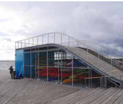
I Faaborg kan nybegyndere leje havkajakker og få undervisning. Havkajakkerne opbevares synligt bag et aflåst gitterhegn.