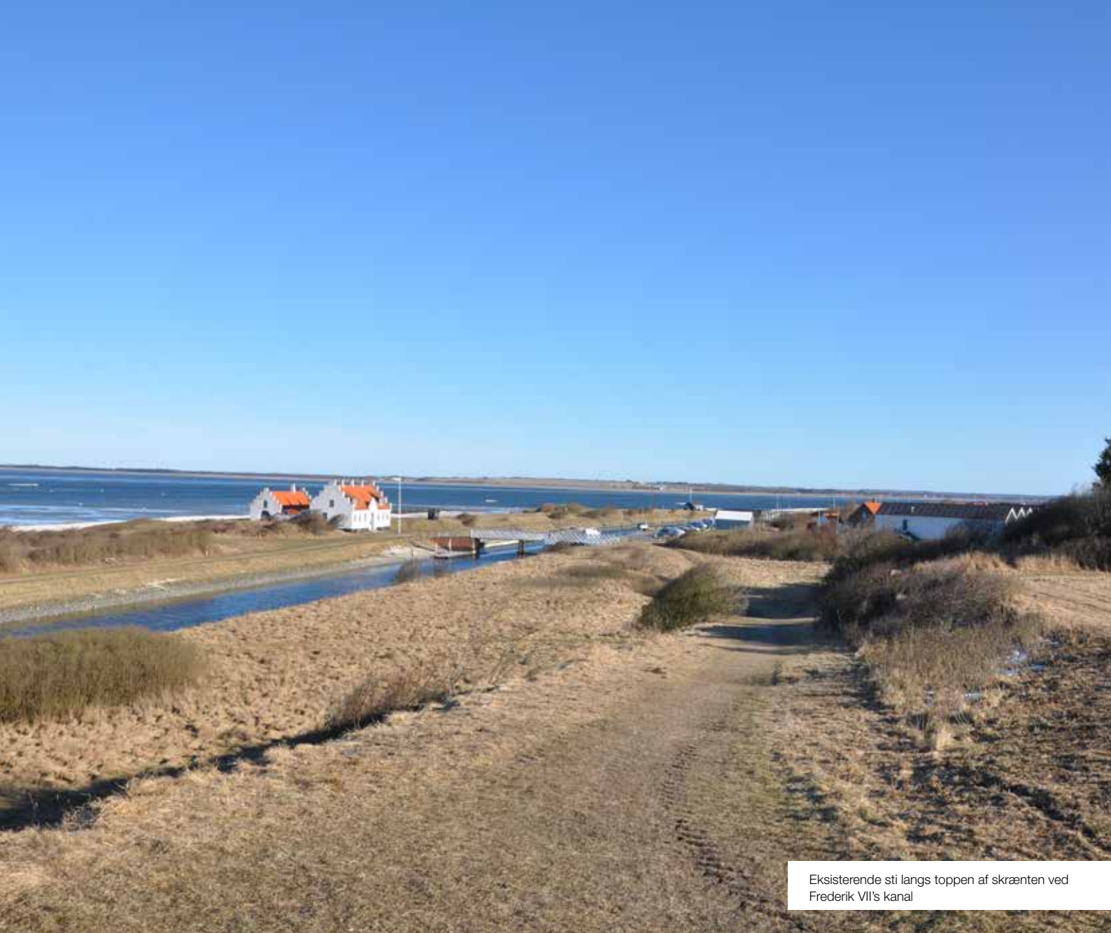
Eksisterende sti langs toppen af skrænten ved Frederik VII's kanal

Stien vil kunne bruges som en del af træningen for foreningerne på Lanternen, af skolen og rideklubben (dele af strækningen), og ikke mindst af alle, som blot har lyst til at komme ud i den friske luft. Det er populært at dyrke udendørs aktiviteter. Mange går, løber eller cykler. Det er en fleksibel og let form for motion, der kan passes ind i en travl hverdag hele året rundt. Gode udendørs aktivitetsmuligheder er derfor også en del af et attraktivt boligområde.