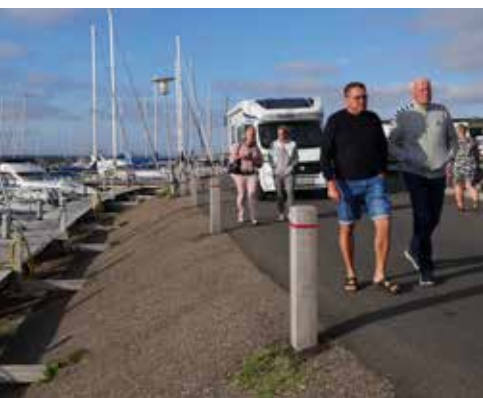
Fodgængere og biltrafik er blandet på den kun 4-5 m brede Kanalvejen. Et boardwalk i træ ud over skråningen mod kanalen vil gøre det helt anderledes attraktivt at færdes til fods og opholde sig ved kanalen.