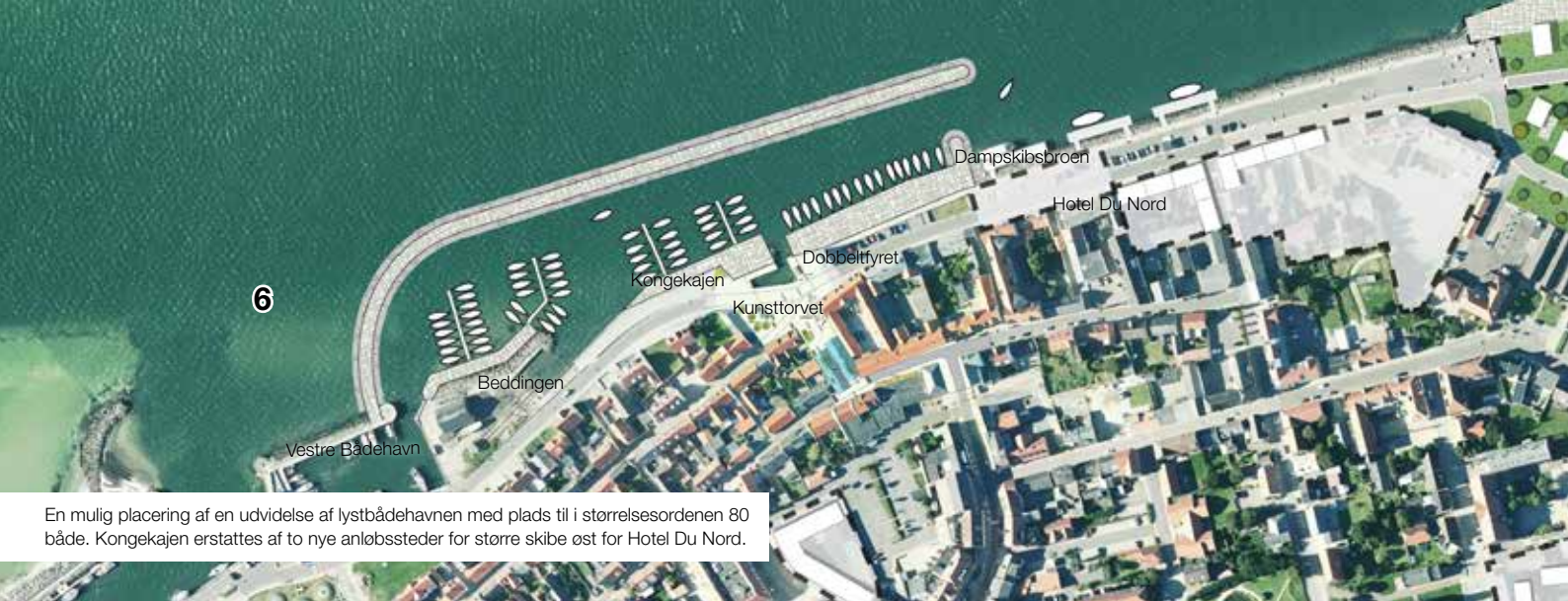
En mulig placering af en udvidelse af lystbådehavnen med plads til i størrelsesordenen 80 både. Kongekajen erstattes af to nye anløbssteder for større skibe øst for Hotel Du Nord.