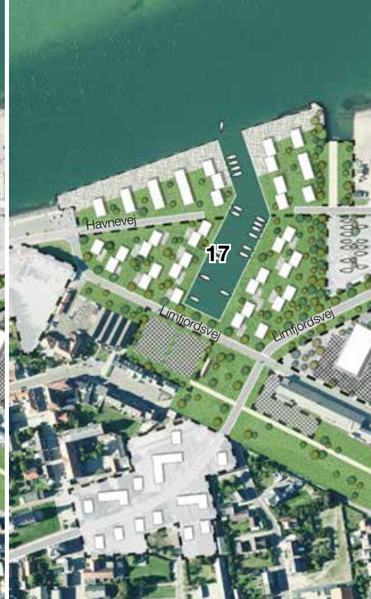
ETAPE 3- Området bliver fuldt udbygget.