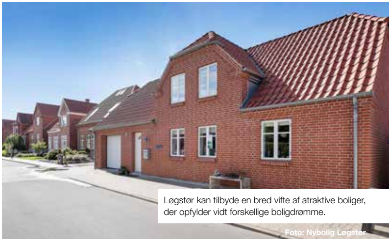
Løgstør kan tilbyde en bred vifte af attraktive boliger, der opfylder vidt forskellige boligdrømme.