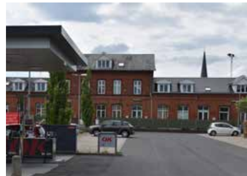
Stationsbygningen kan få en flot og markant plads i bybilledet.

Bebyggelsen mellem Hotel Du Nord og Limfjordsvej kan udnyttes bedre. Der er en fantastisk udsigt over vandet, men en del af bebyggelsen virker nedslidt, og der er huller i husrækken ud mod Havnevej. Udviklingsplanen peger på muligheden, men det vil være grundejerne, der skal se muligheden, og der er flere ejere, som skal finde sammen om projektet.