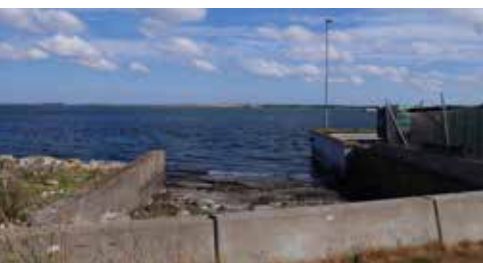
Det gamle slæbested kunne måske genåbnes.