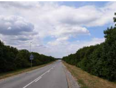
Sdr. Ringvej er smal og foreslås udvidet med bredere kørebane, cykelstier og bedre belysning.

Der er behov for udbygning af Sdr. Ringvej - særligt efter at Lanternen er kommet til og i takt med at boligområderne ved Majsmarken, Sjægten, Skonnerten, Udsigten og Golfparken er blevet bebygget. Der er behov for at udvide den smalle kørebane, udbygge med stier langs begge sider af vejen, forbedre gadelyset, samt at sikre krydsene ved Sønderport og Frederik VII's Allé.