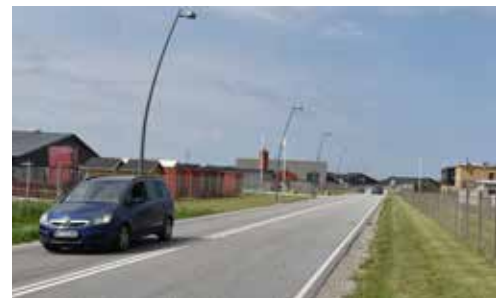
Langs erhvervsområdet kunne Havnevej forskønnes med en markant træallé.