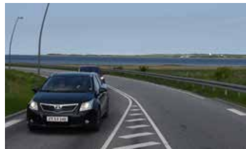
På den første del af Havnevej er der en smuk udsigt over fjorden og landskaberne.

Å vejforløbet gennem erhvervsområdet (Havnevej) er der behov for forskønnelse (projektforslag 7). En markant allé langs den lige vej kunne løfte indtrykket på vej ind mod byen.