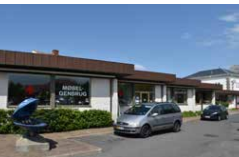
Butikkerne i den tidligere bankbygning kunne også åbne sig mod Købmagergade og gøre det mere interessant at færdes fra havnen til bymidten.

Et nyt forslag er at udvide Kunsttorvet, så pladsen kommer til at hænge sammen med Købmagergade. Det forudsætter, at ejeren af ejendomme ud til Købmagergade er interesseret i at sælge. Udvidelsen af Kunsttorvet kunne give plads til et stort glasoverdækket byrum, som kan blive en ny attraktion og give nye muligheder for aktiviteter - også når vejret ikke egner sig til at være ude. Hvis løsningen bliver gennemført, skal den tænkes sammen med en ændring af den gamle bankbygning på hjørnet af Østerbrogade og Købmagergade, så den får en mere aktiv og tiltrækkende facade mod Købmagergade. Det handler om, at gæsterne på havnen skal ledes op mod byen og nå frem til Østerbrogade. I den tidligere bankbygning er der bl.a. genbrugsbutik, som kunne have facade og indgang fra Købmagergade, men det skal der arbejdes videre med.