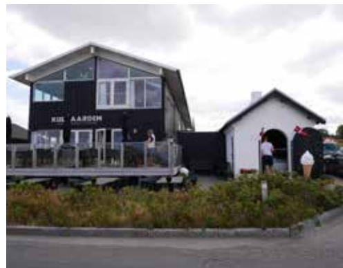
Kulgården kunne udvides med en tilbygning ind mod autocamperpladsen, så der bliver plads til mere udeservering med udsigt over kanalen.

Restaurant Kulgården er et populært spisested, som også kan bruge mere plads. En mulighed kan være at bygge til ind mod autocamperpladsen. Hvis servicefaciliteterne for lystsejlerne flyttes til et vandaktivitetshus, så vil det også give mere plads til at udvide restauranten på 1. sal.