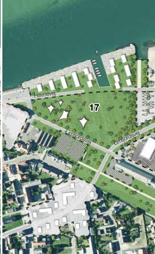
ETAPE 2- Første del af kanalen og boligbyggeriet anlægges.