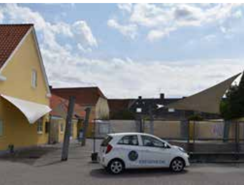
Havn og bymidte kan bindes bedre sammen ved at udvide Kunsttorvet til Købmagergade. En del af pladsen kunne indrettes med et glasoverdækket byrum til udendørs aktiviteter, når vejret er dårligt.

Sammenhængen mellem bymidten og havnen er ikke optimal. Der er behov for en ny og bedre forbindelse, som motiverer flere til at færdes mellem havnen og bymidten. Der er mange turister og besøgende på havnen, men for få finder vej til bymidtens butikker og spisesteder. Den forrige udviklingsplan indeholdt forskellige løsningsforslag, men den rigtige og realiserbare løsning er endnu ikke fundet.