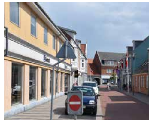
Den første del af Torvegade er blomstret op. Garantbygningen og bygningerne hen mod den kommunale administrationsbygning kunne omdannes til boliger.

Forslaget om at gøre Blindebomsgade til hovedindfaldsvej til bymidten - og dobbeltrette Østerbrogade fra Blindebomsgade til Bredgade - er koblet sammen med et forslag om at udvide parkeringspladsen i karreen mellem Østerbrogade og Fogedgade. En udvidelse af parkeringsmulighederne på dette sted vil være optimal i forhold til butikkerne i Østerbrogade, da kunderne ankommer til bymidten netop her. Hvor stor udvidelsen kan blive afhænger bl.a. af mulighederne for at erhverve arealerne i karrén.