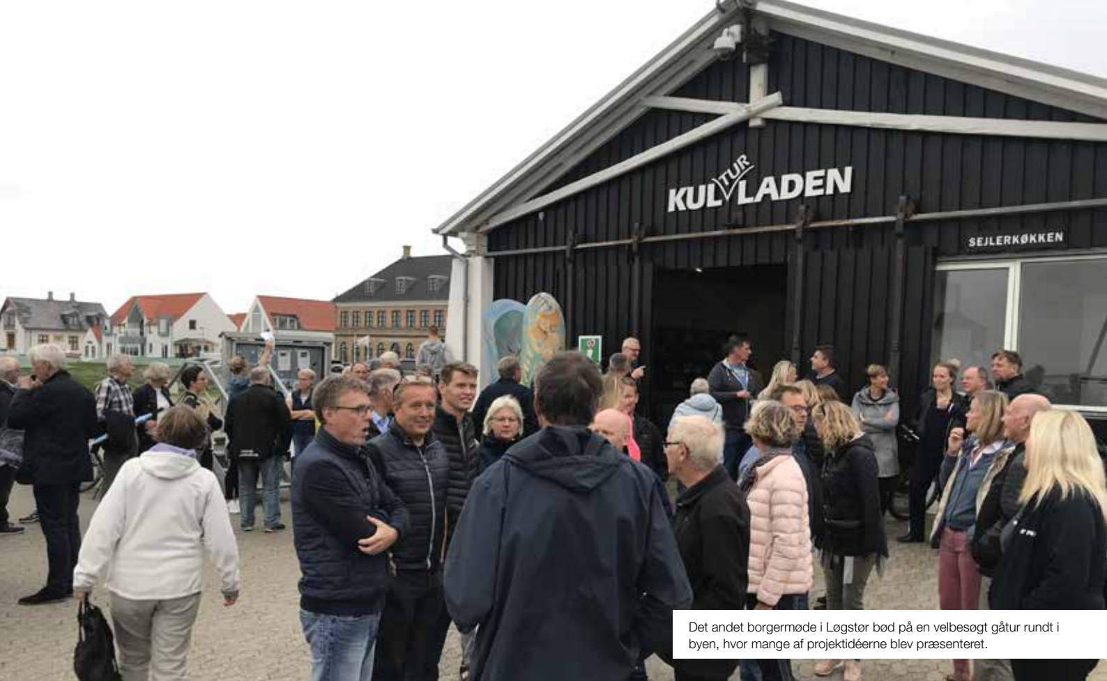
Det andet borgermøde i Løgstør bød på en velbesøgt gåtur rundt i byen, hvor mange af projektidéerne blev præsenteret.