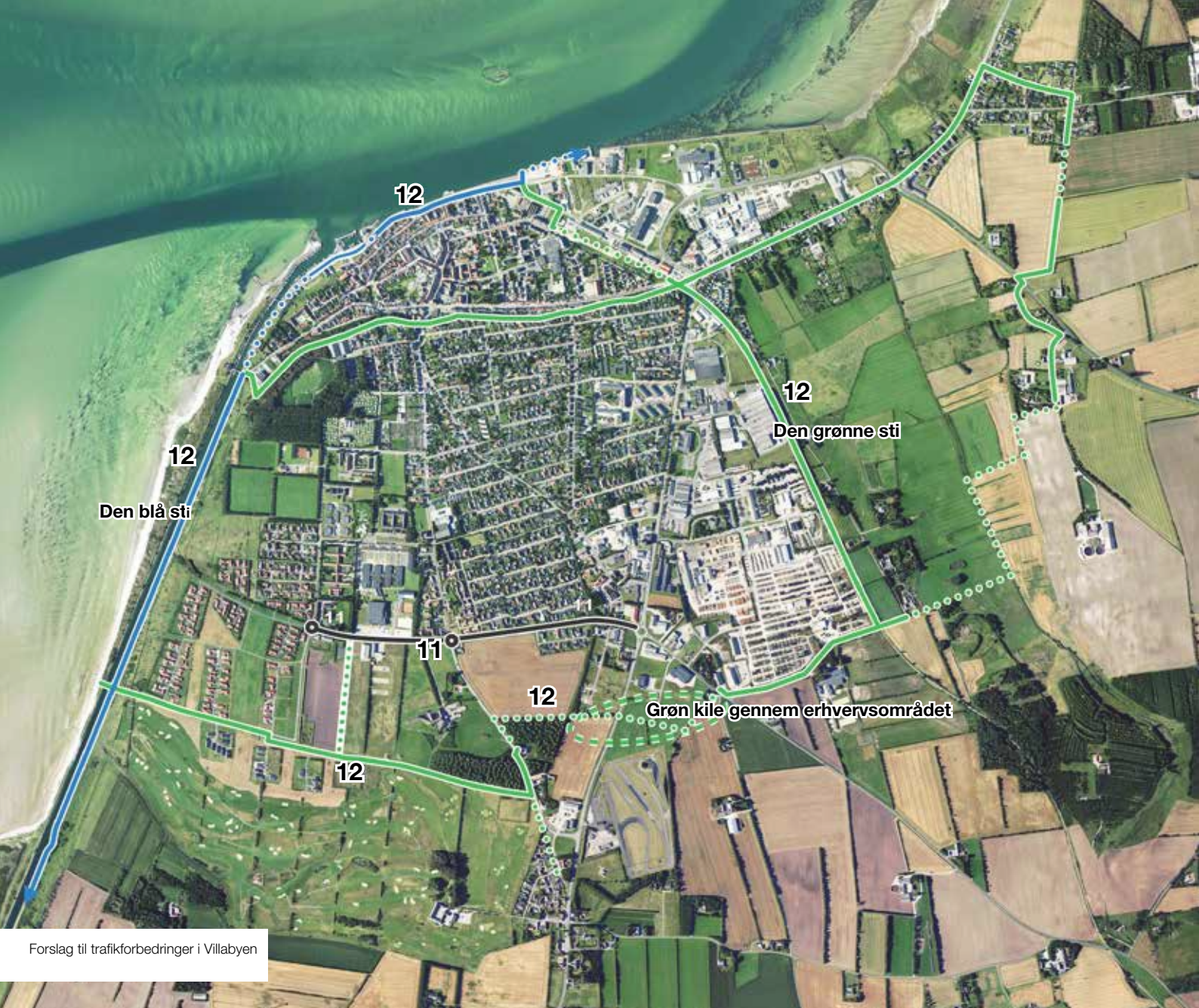
Forslag til trafikforbedringer i Villabyen