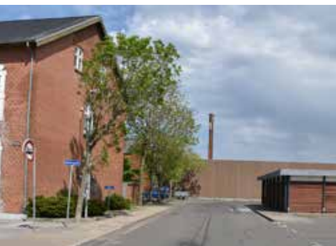
Udviklingsplanen foreslår, at Blindebomsgade forlænges til banearealet, og at Larsen Seafood, den tidligere realskole og rutebilstationen omdannes til et nyt byområde.

Området fastholdes som byomdannelsesområde, som også inkluderer den tidligere realskole og rutebilstationen. Når Blindebomsgade og Havnevej bliver hovedindfaldsvejen til bymidten vil området få en mere central beliggenhed i byen, som giver nye muligheder for at realisere en omdannelse. Med en ny hovedindfaldsvej som beskrevet kan den nuværende rutebilstation laves om til et stoppested på en gennemgående rute. Der er et forslag til, hvordan busruterne kan lægges om, så der bliver bedre betjening af Løgstør. Det er beskrevet under temaet "Villabyen" (projektforslag 7). I forbindelse med omdannelse af området, skal der findes en ny placering til rutebilstationen.