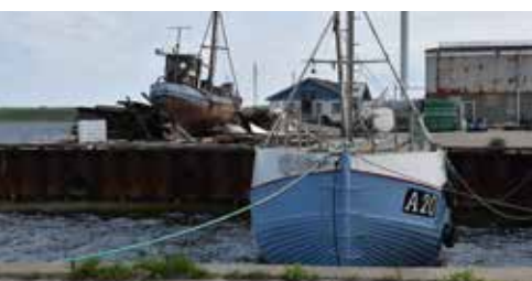
Den gamle industrihavn bevares og udnyttes til ophaling af både og eksempelvis til fiskerbåde.